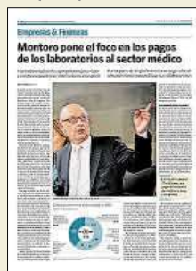
'elEconomista' informó en julio de 2016 de las intenciones del Ministerio de Hacienda.

bían pedido ya a los laboratorios que éstos transfirieran todos los pagos por formación a las sociedades médicas -y no de manera individual- y fueran éstas las que posteriormente gestionaran este dinero con los médicos. "Este enfoque permitiría que este tipo de formación pueda justificadamente no estar sujeta a carga fiscal", aseguran desde la Federación de Asociaciones Científico Médicas Españolas, entidad que agrupa a 42 sociedades médicas.